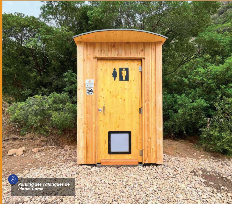
Parking des calanques de Piana, Corse